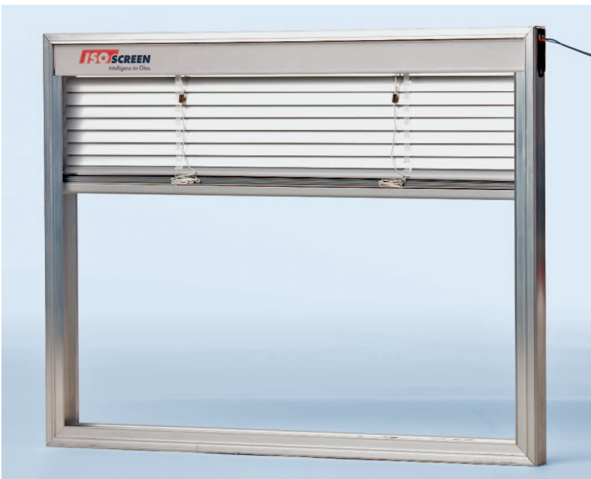
Vor 21 Jahren wurde die weltweit erste Isolierglas Jalousie auf der Messe R+T in Stuttgart vorgestellt. Abgebildet ist die stetig weiterentwickelte Isolierglas Jalousie IsoScreen.

Trotz höchster Qualität und Zuverlässigkeit kann es auch bei Isolierglas Jalousien im Lauf mehrerer Jahre zu Verschleißerscheinungen kommen, so dass unter Umständen ein Austausch des Antriebmotors erforderlich wird. Bei herkömmlichen Systemen ist dies entweder nicht möglich oder es ist zwangsläufig ein Durchbruch in den Scheibenzwischenräumen damit verbunden, wodurch Edelgas entweicht und der Wärmedämmwert der Scheiben